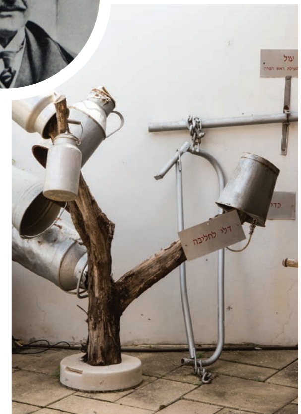
מוזיאון לתולדות גוש תל מונד הדקל 44, תל מונד

בנוסף לצריפי הפועלים, בנה הלורד הנדיב מטבח שיתופי לפועלים הרווקים. נכון שבתקופה עיקר התפריט התבסס על קומץ גידולים חקלאיים ורוב התזונה התבססה על תפוזים ועדיין במונחים של התקופה ההיא נחשב המטבח בבית הביטחון, לחלום של כל רווק או כפי שאז נהגו לומר שופרא דה שופרא.