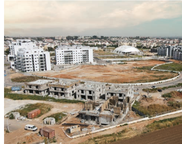
גולדה הצעירה, גדרה | 14 יח"ד (בתים דו-משפחתיים)