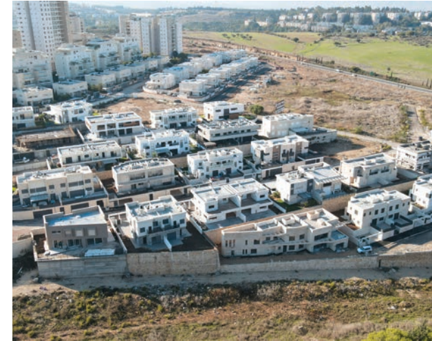
גבעת אלונים, קרית אתא | 38 יחידות (בתים דו-משפחתיים)