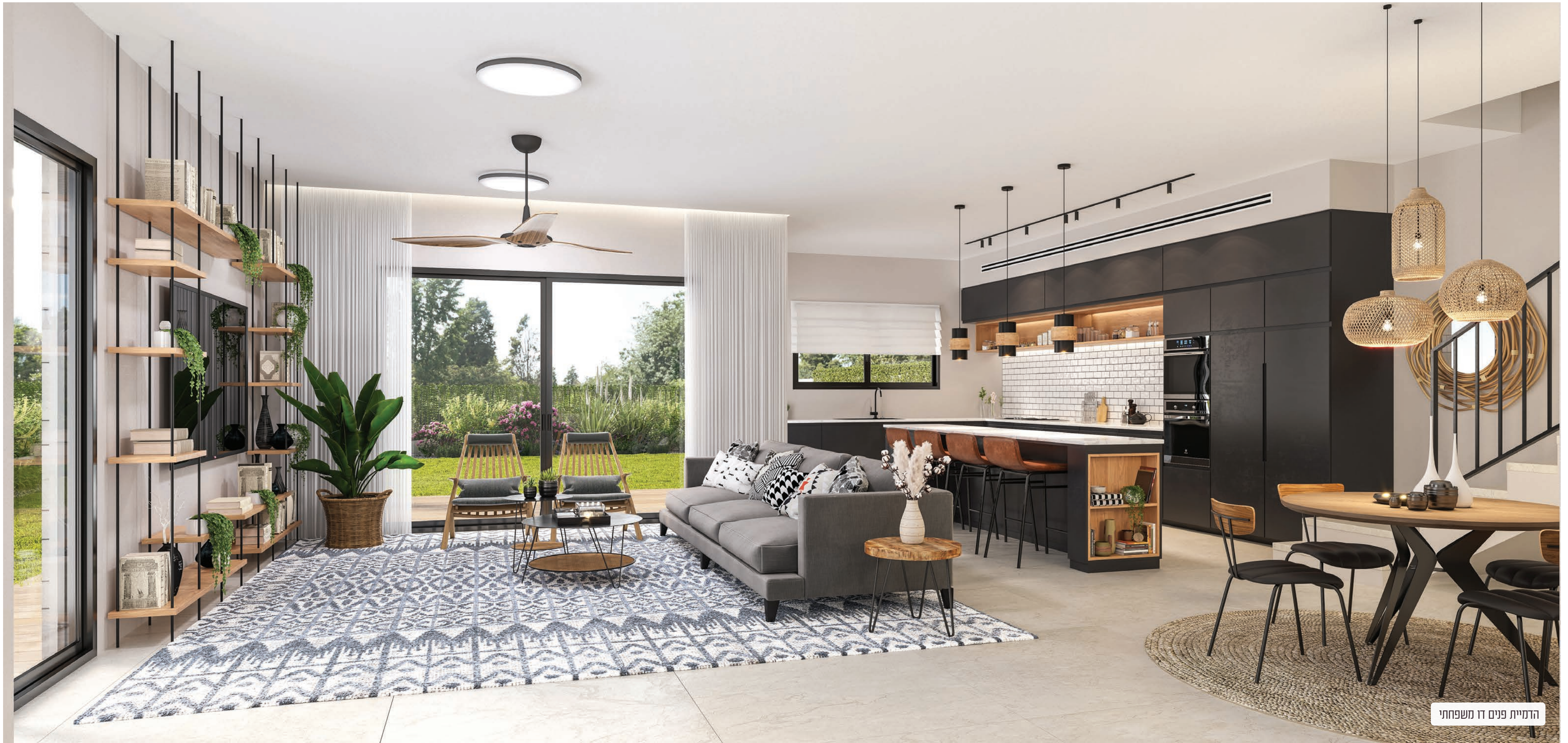
הדמיית פנים דו משפחתי