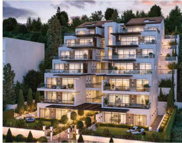
בית השגריר, צלבים בניין בוטיק 14 יחידות (דירות 4/5 חדרים, דירות גן ופנטהאוזים)