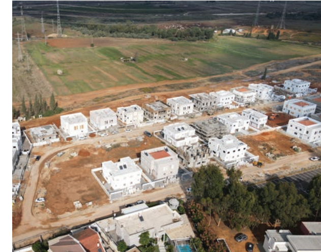
בית אליעזר, חדרה | 72 יחידות (בתים דו-משפחתיים)