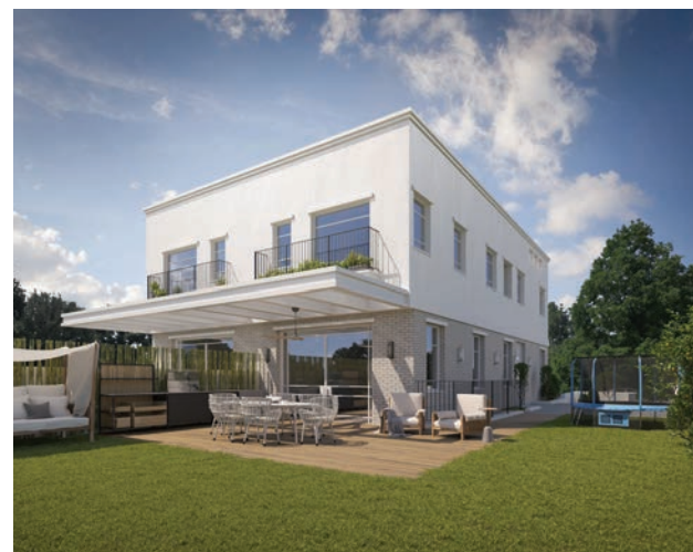
תל מונד | 56 יחידות