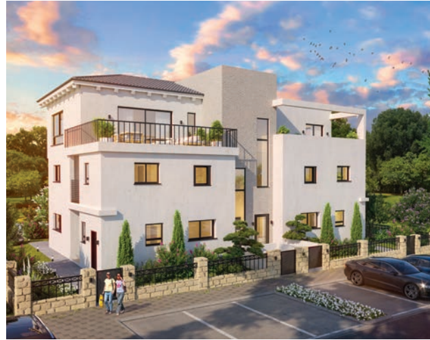
מעלה אורנים, טבעון | 115 יחידות (מבני בוטיק 3 יח"ד)