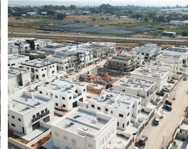
שרונה, כפר יונה | 42 יחידות (בתים דו-משפחתיים)