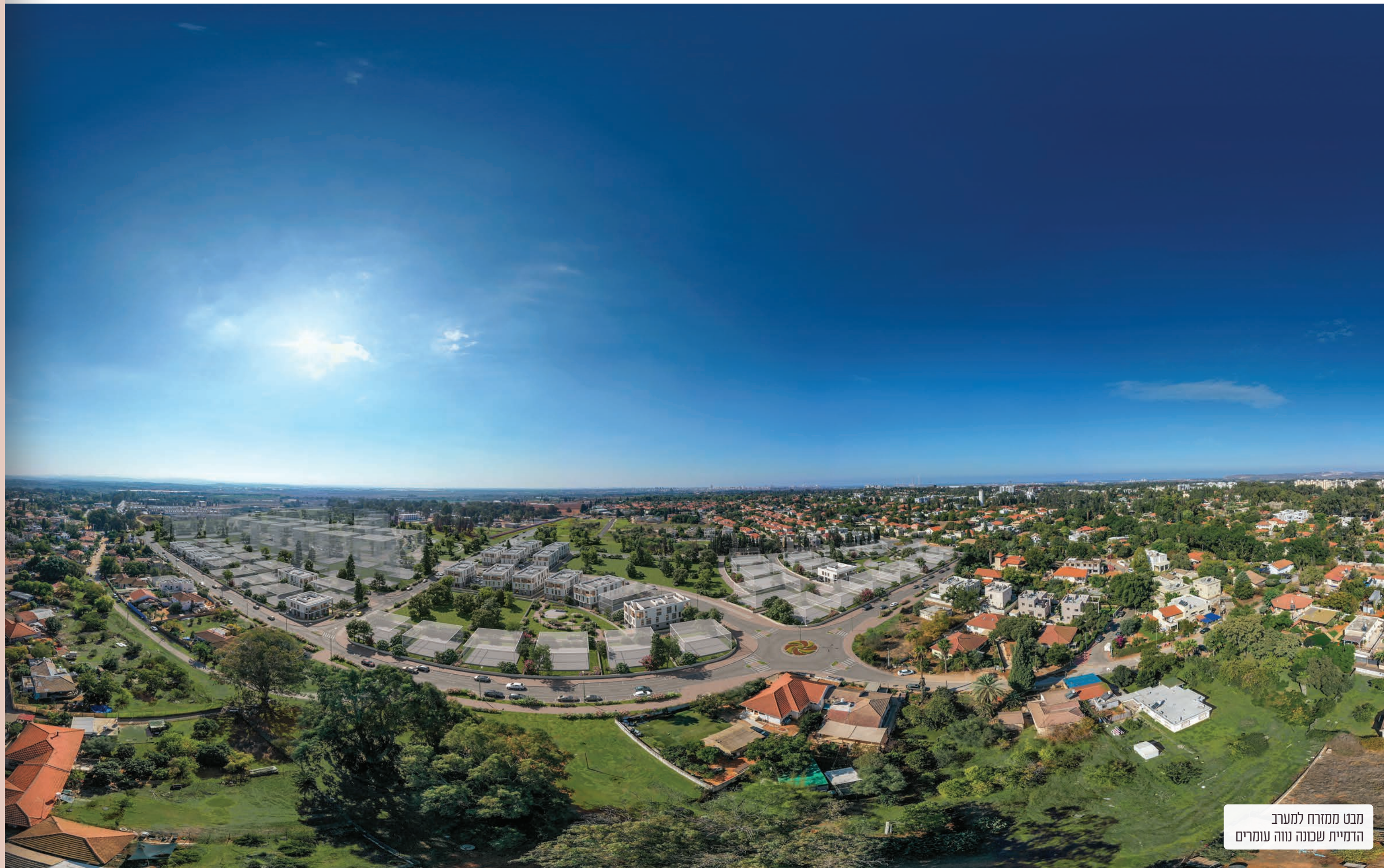
מבט ממזרח למערב הדמיית שכונה נווה עומרים

הבתים מתאפיינים בבנייה איכותית ומוקפדת עם מפרט טכני משודרג, המבטיחה למשפחה שלכם חווית מגורים שלווה וכפרית, איכות חיים טובה בקהילה מתפתחת וצעירה ומהווים מוקד משיכה גם לתושבים המתגוררים בשכונות הסמוכות