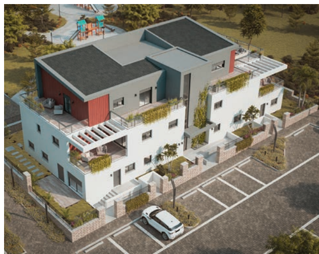
אביב בטבעון | 42 יחידות