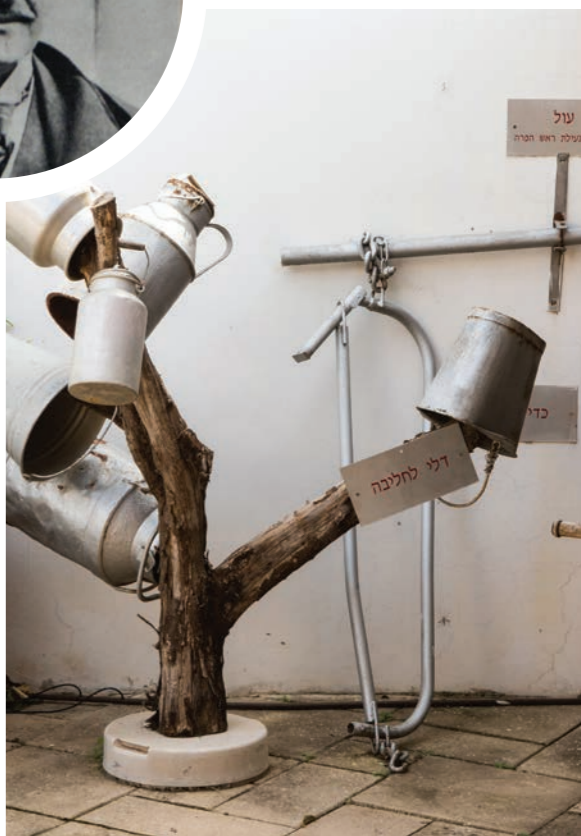
מוזיאון לתולדות גוש תל מונד הדקל 44, תל מונד

בנוסף לצריפי הפועלים, בנה הלורד הנדיב מטבח שיתופי לפועלים הרווקים. נכון שבתקופה עיקר התפריט התבסס על קומץ גידולים חקלאיים ורוב התזונה התבססה על תפוזים ועדיין במונחים של התקופה היא נחשב המטבח בבית הביטחון, לחלום של כל רווק או כפי שאז נהגו לומר שופרא דה שופרא.