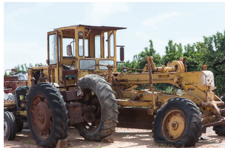
מוזיאון הטרקטורים והמיכון החקלאי עין ורד

מוזיאון הטרקטור שבגוש תל מונד הוא מקום מיוחד לחובבי ההיסטוריה ומהווה אטרקציה לכל גיל. אוסף הטרקטורים מכיל כלי חקלאות ממונעים, כלים רתומים וטרקטורים מראשית המאה הקודמת ששימשו את חקלאי הארץ מראשית ההתיישבות העברית החדשה בה. האוסף מופעל על ידי עמותה ציבורית ומכיל טרקטורים וכלי חקלאות ממונעים ונרתמים. כלים אלו מוצגים לציבור במושב עין ורד. העמותה עוסקת באיסוף, שיקום וגיוס המשאבים הדרושים להצלת הכלים ופועלת לתפעול שוטף והקמת בית של קבע לאוסף לאומי.