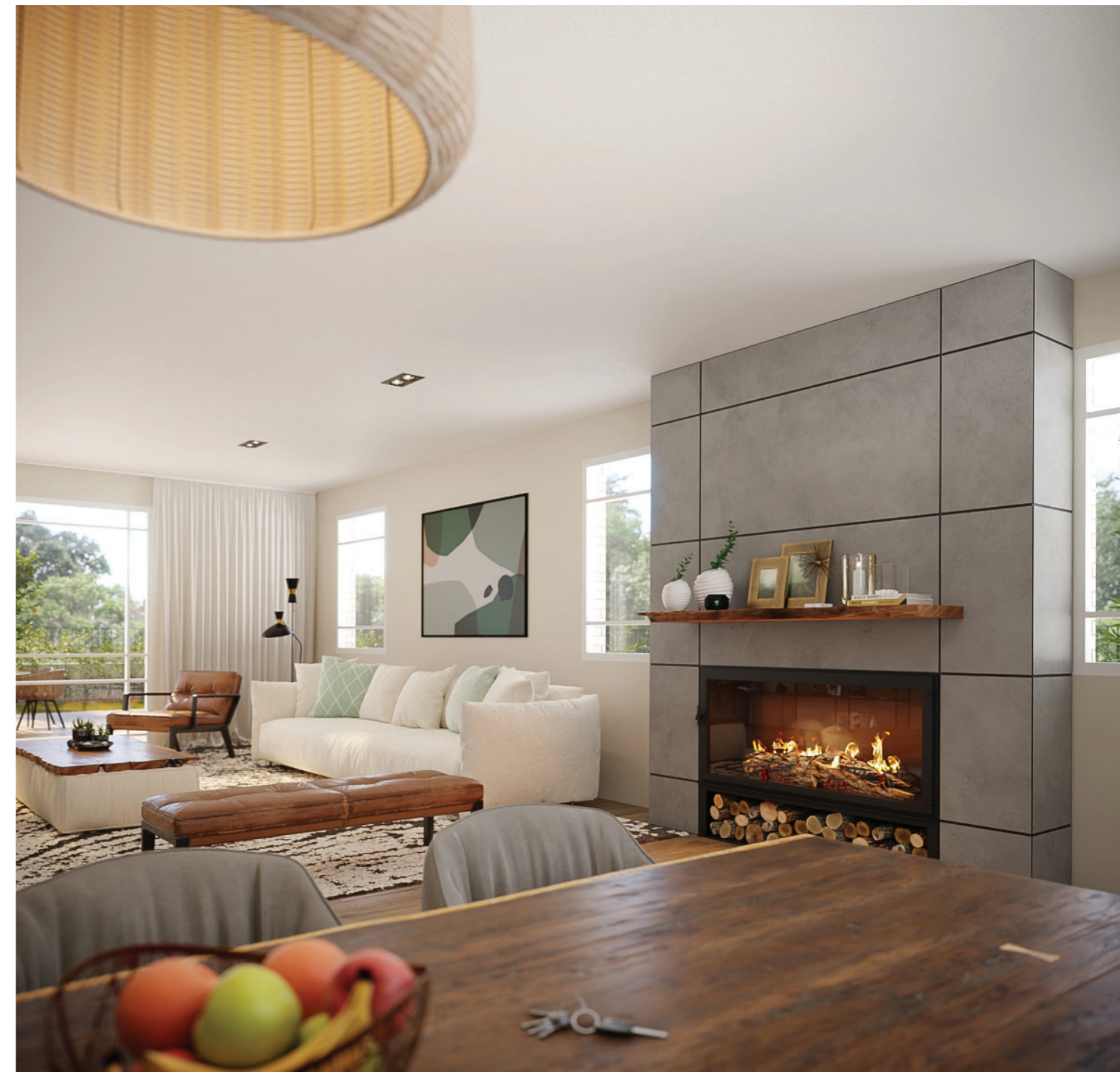
הדמיית פנים פינת אונל ↑