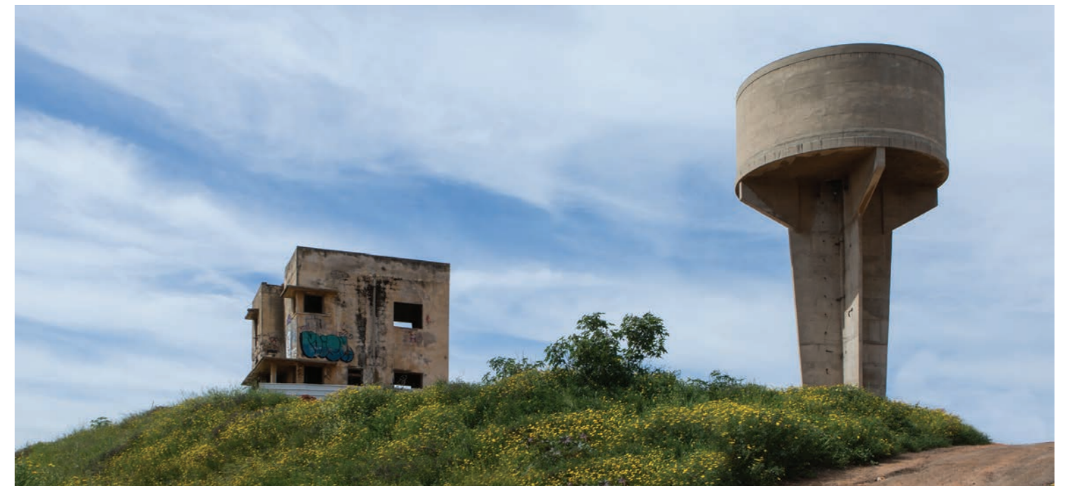
מגדל מים לשימור ↑