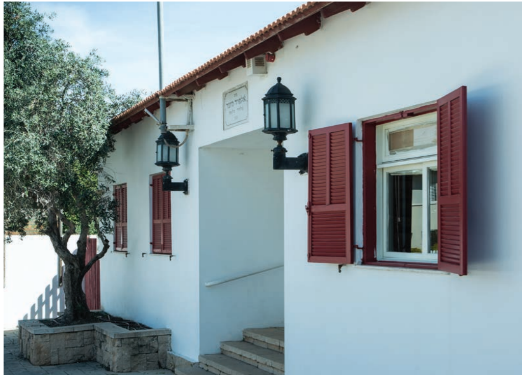
בית הלורד הדקל 44, תל מונד