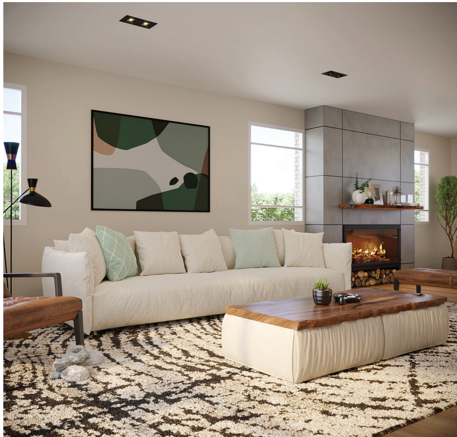
הדמיית פנים סלון ↑