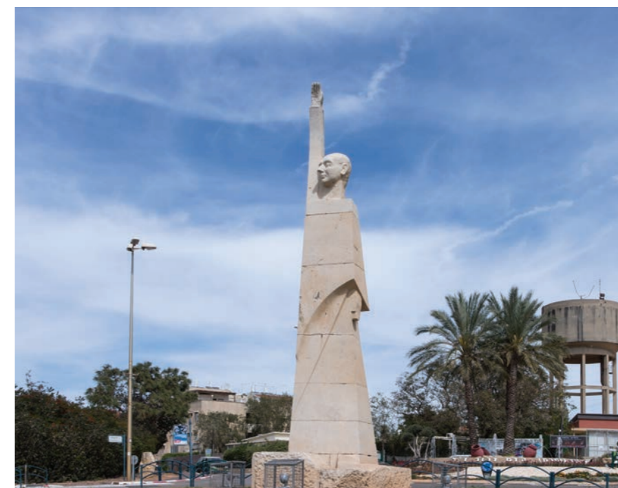
פסל אלפרד מונד ←