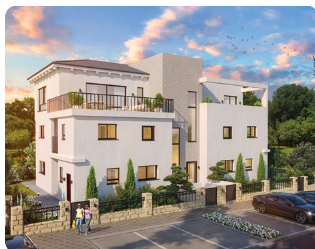
מעלה אורנים, טבעון | 115 יחידות (מבני בוטיק 3 יח"ד)