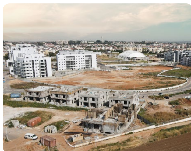
גולדה הצעירה, גדרה | 14 יח"ד (בתים דו משפחתיים)