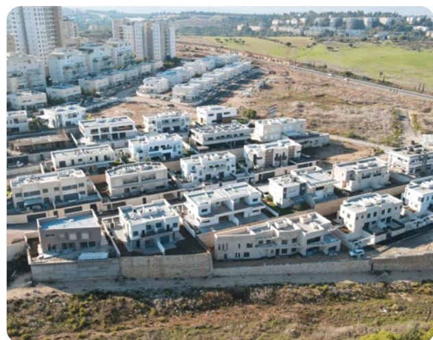
גבעת אלונים, קרית אתא | 38 יחידות (בתים דו-משפחתיים)