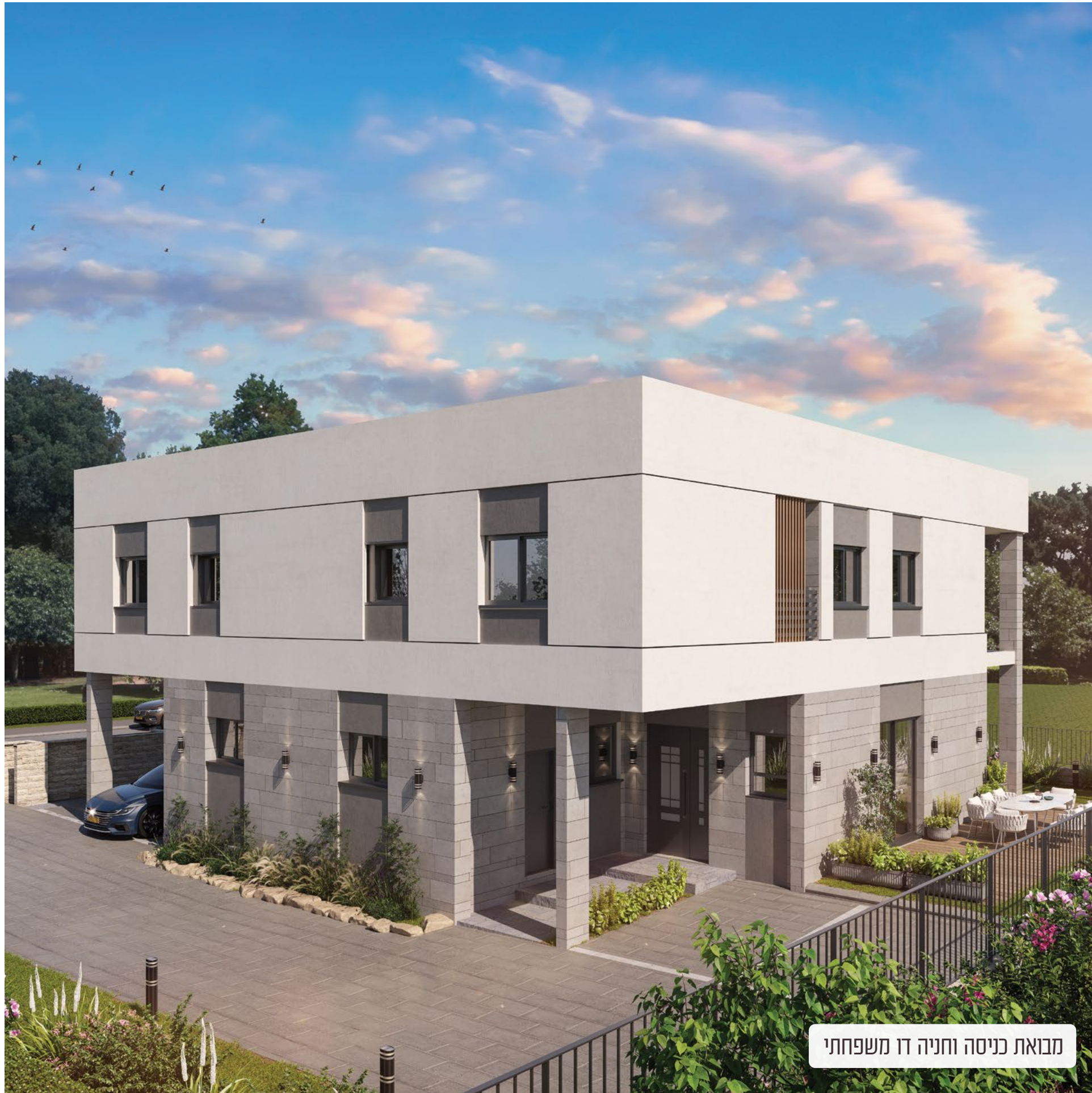
מבואת כניסה וחניה דו משפחתי