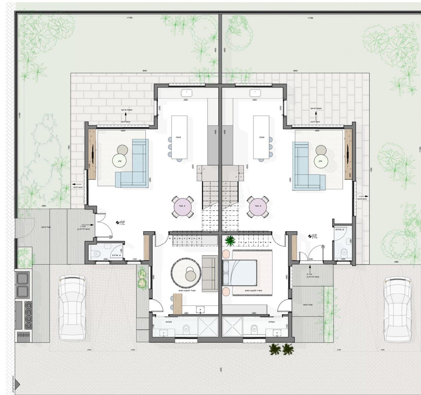
תוכנית קומת קרקע