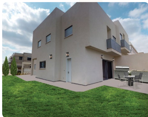
שרונה, כפר יונה | 42 יחידות (בתים דו-משפחתיים)