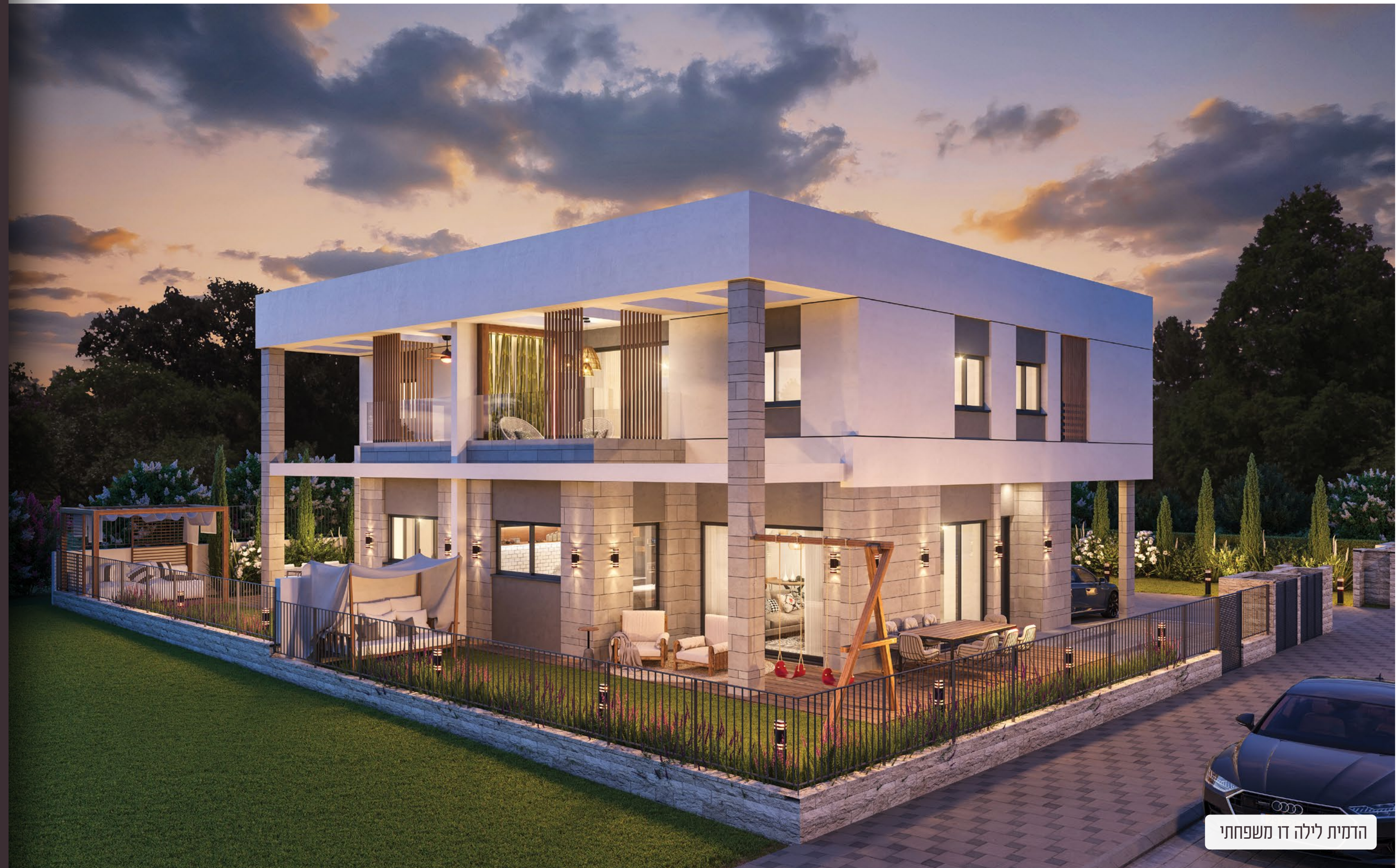
הדמית לילה דו משפחתי

חברתנו מתמחה ביחס אישי ואנושי לכל לקוח, תוך הבנה מעמיקה בתחום הנדל"ן בשוק הישראלי. הדגש העיקרי הוא שירות ומענה אישי מהפגישה הראשונה ולאורך כל הדרך.