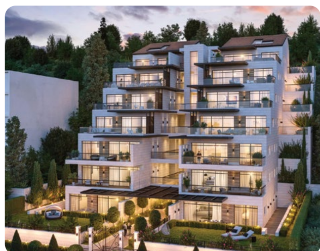
בית השגריר, צלבנים בניין בוטיק | 14 יחידות (דירות 4/5 חדרים, דירות גן ופנטהאוזים)