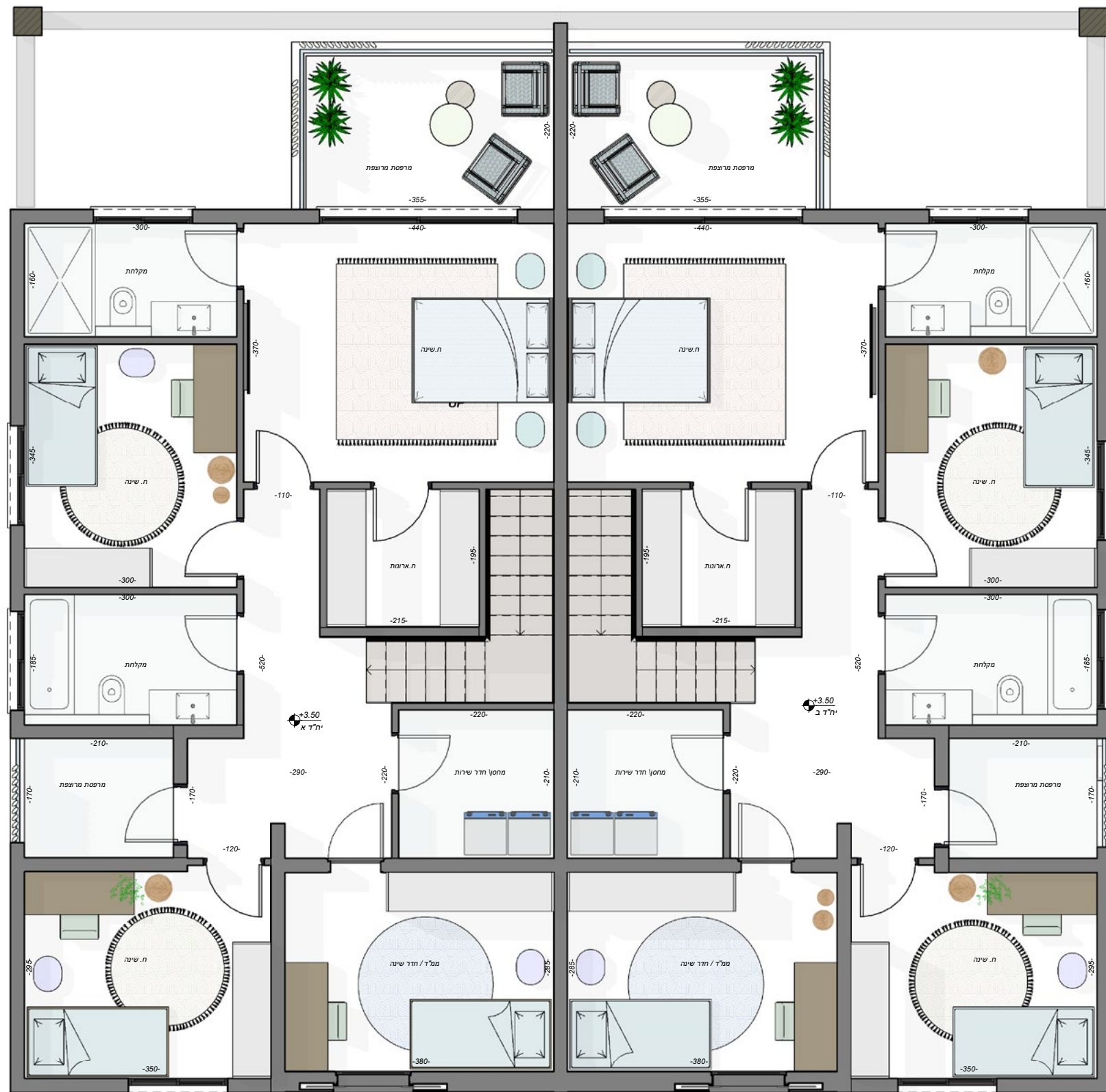
תוכנית קומה א