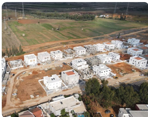
בית אליעזר, חדרה | 72 יחידות (בתים דו-משפחתיים)